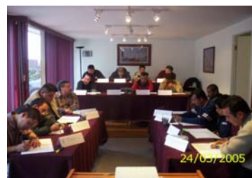
Cursos abiertos al público