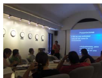
Cursos In House